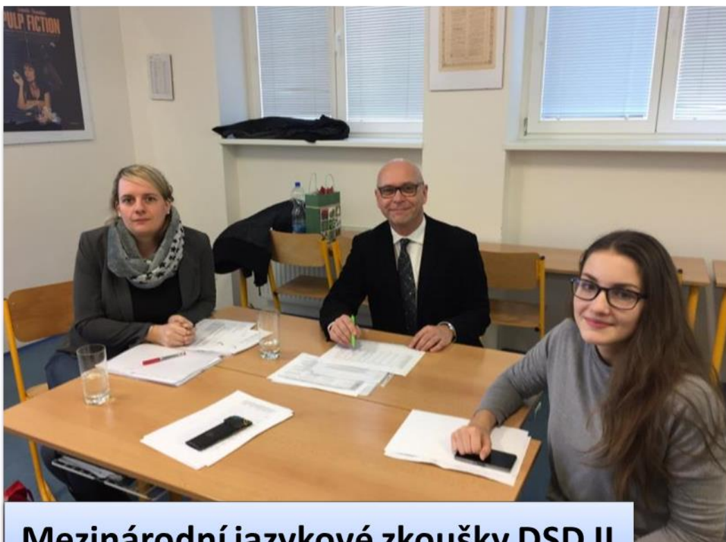
Mezinárodní jazykové zkoušky DSD II