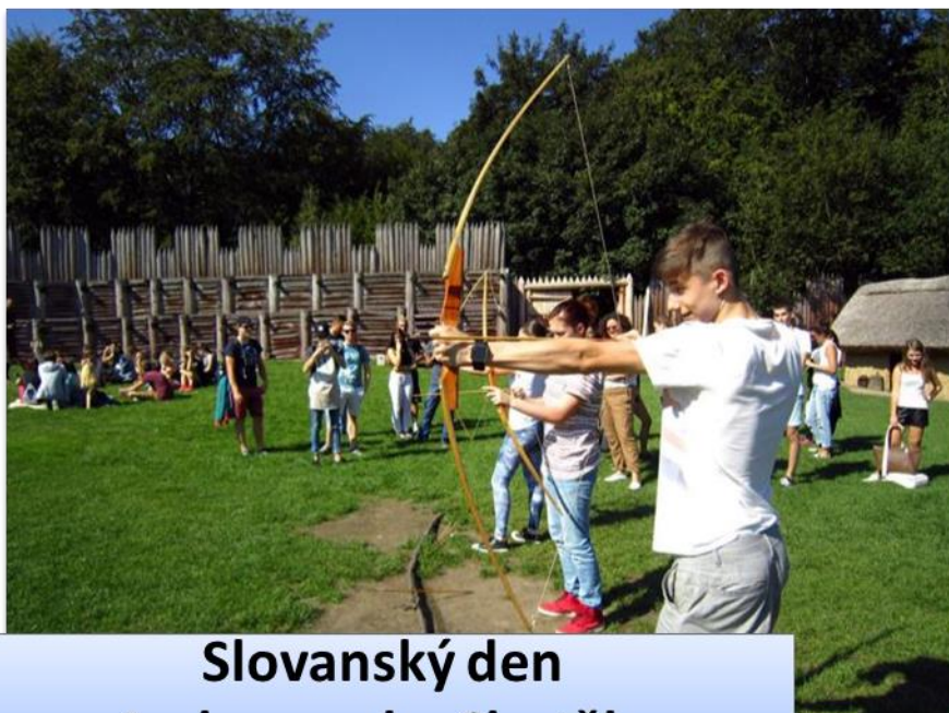
Slovanský den v Archeoparku Chotěbuz