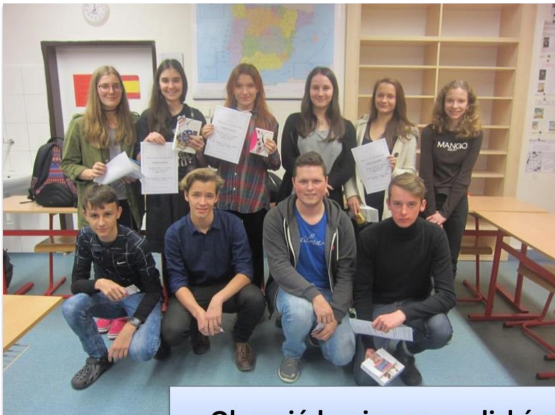
Olympiáda v jazyce anglickém