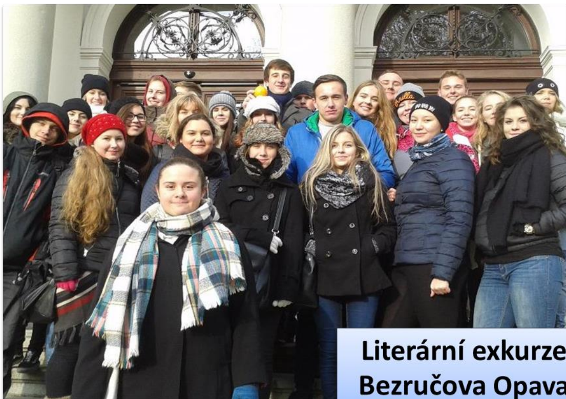
Literární exkurze Bezručova Opava