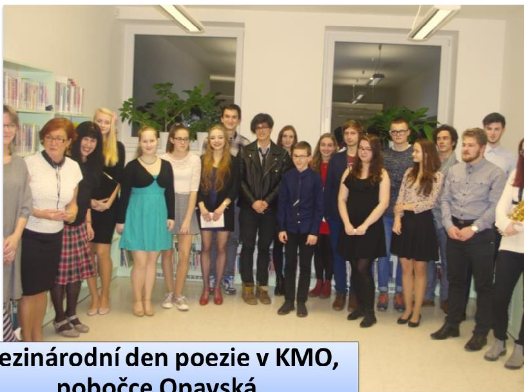
Mezinárodní den poezie v KMO, pobočce Opavská