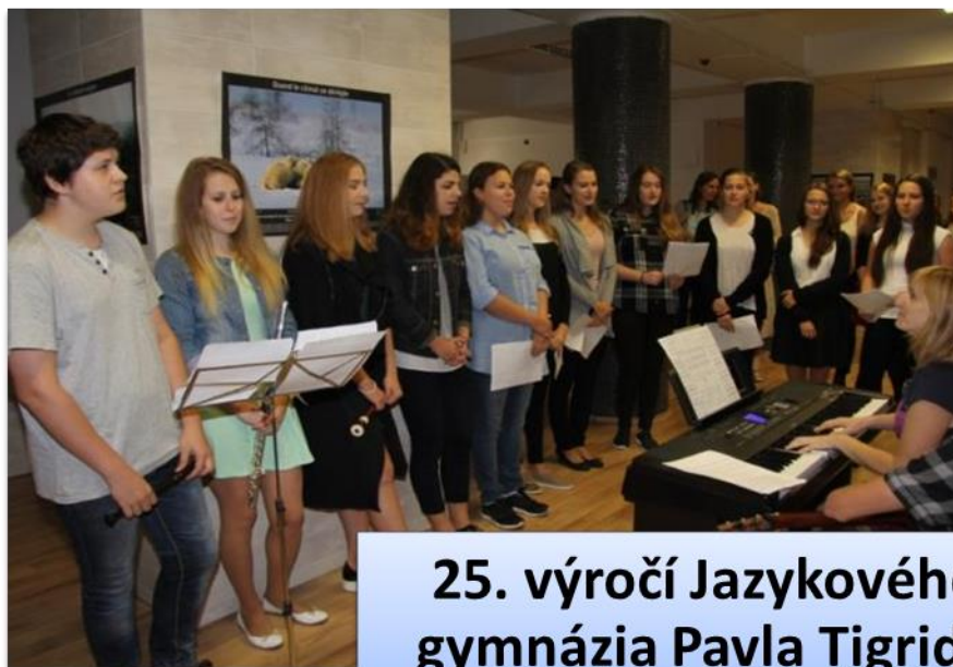
25. výročí Jazykového gymnázia Pavla Tigrida