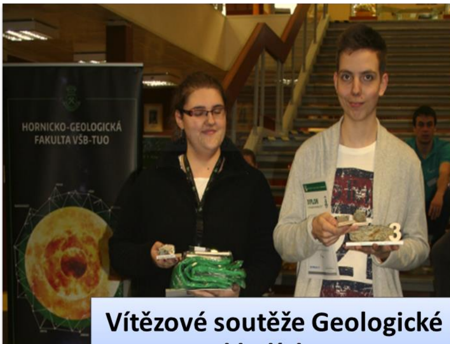
Vítězové soutěže Geologické kladívko