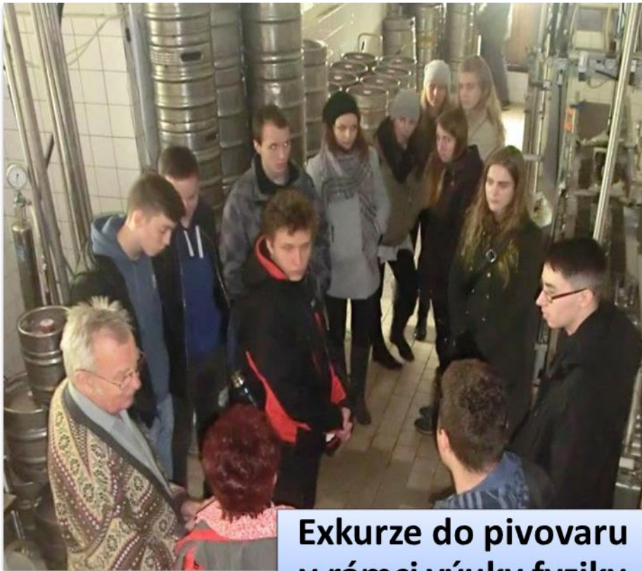
Exkurze do pivovaru v rámci výuky fyziky