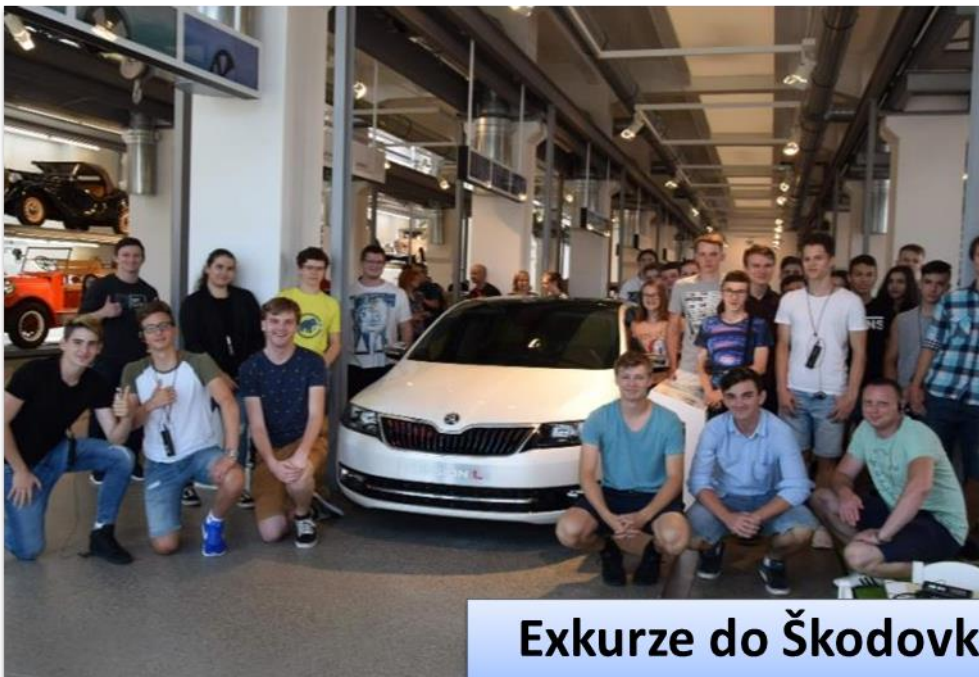
Exkurze do Škodovky