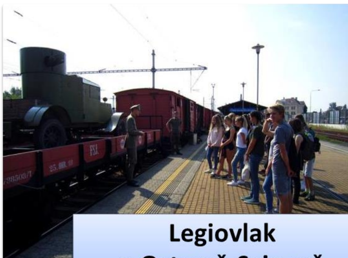
Legiovlak v Ostravě-Svinově