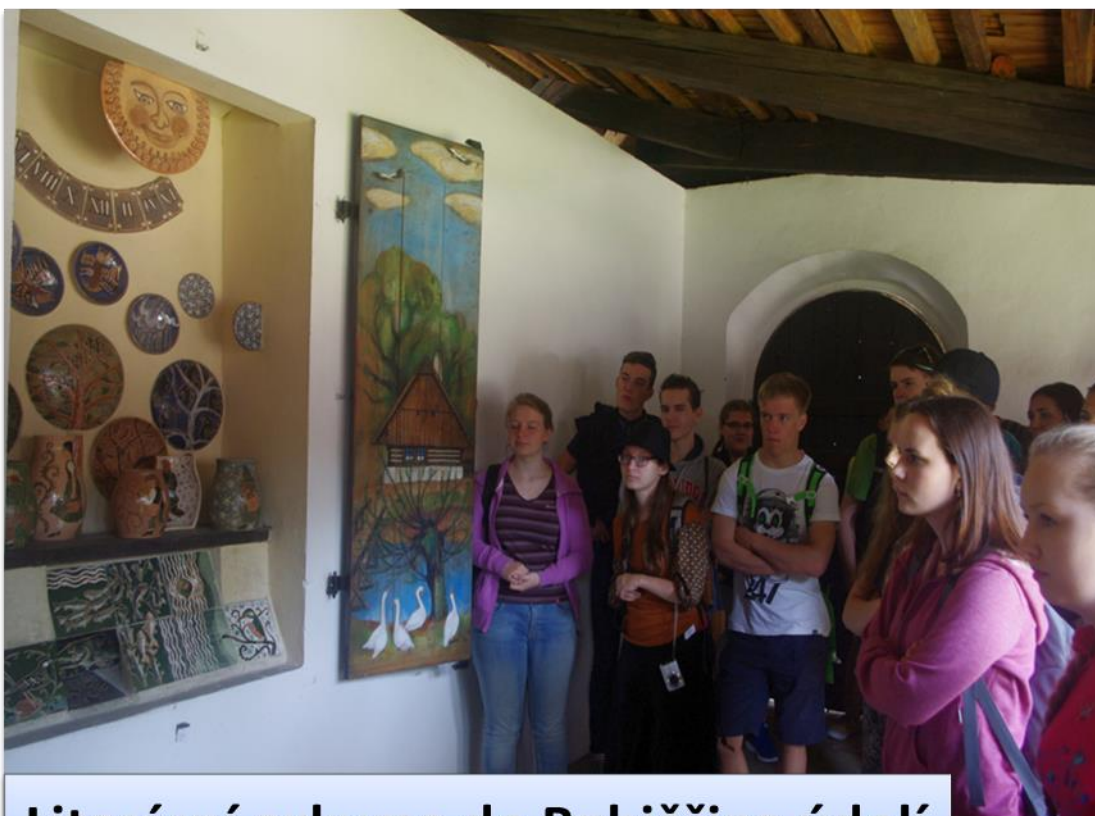
Literární exkurze do Babiččina údolí