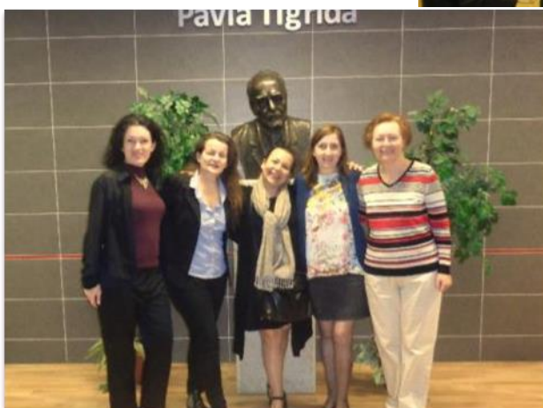
Návštěva atašé pro francouzský jazyk