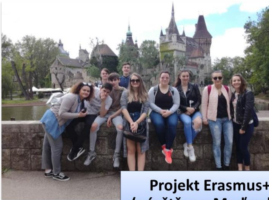
Projekt Erasmus+ (návštěva v Maďarsku)