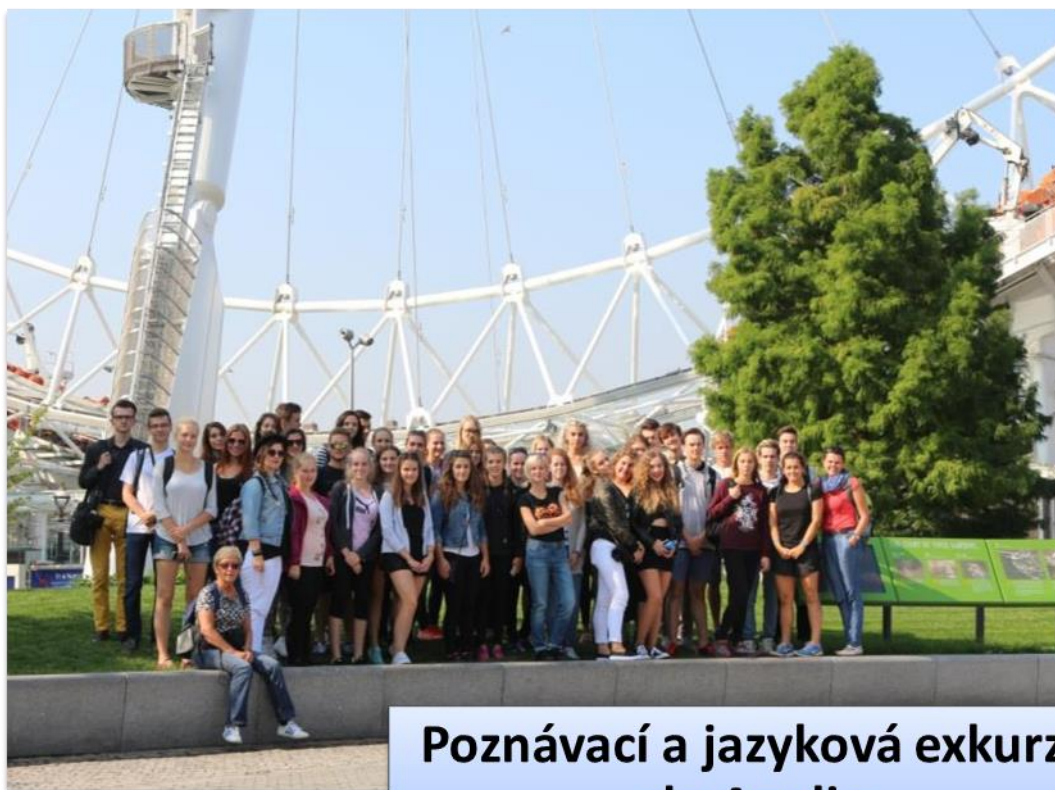
Poznávací a jazyková exkurze do Anglie