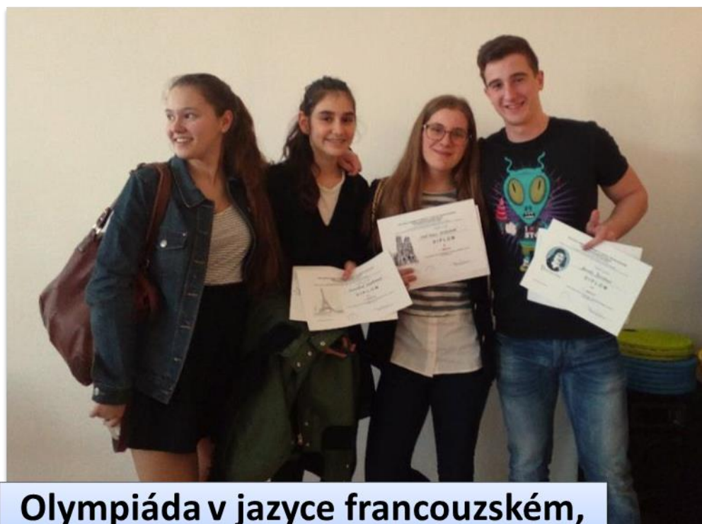
Olympiáda v jazyce francouzském, krajské kolo