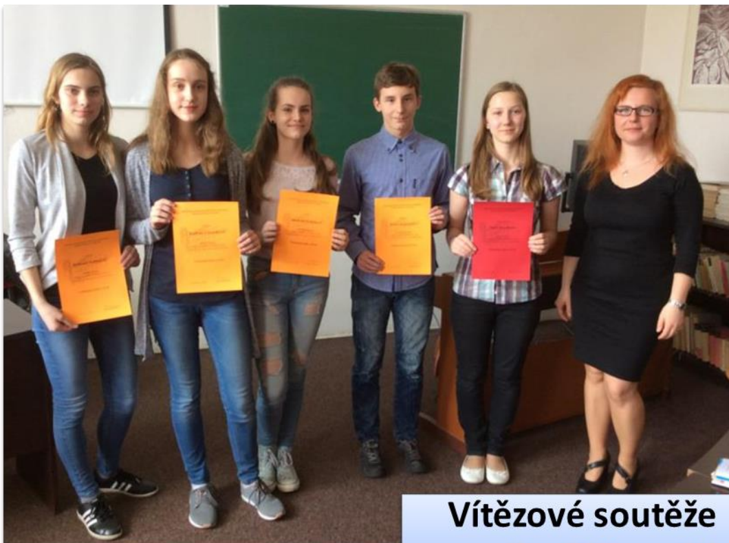
Vítězové soutěže o nejlepší limerick