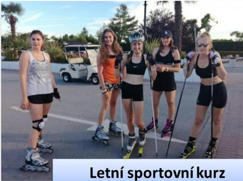
Letní sportovní kurz