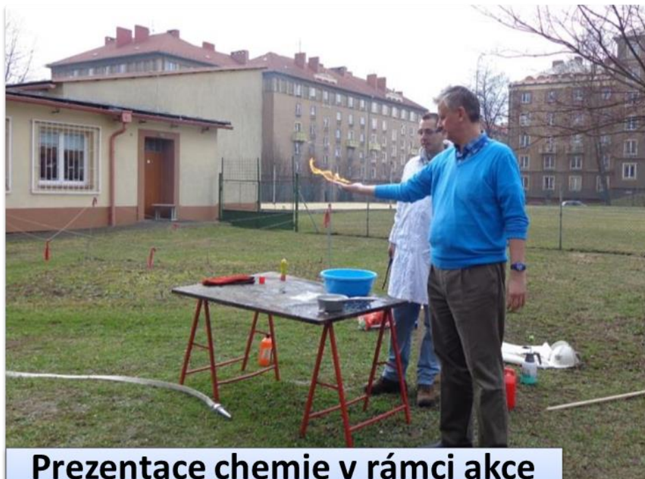
Prezentace chemie v rámci akce Oheň pod kontrolou